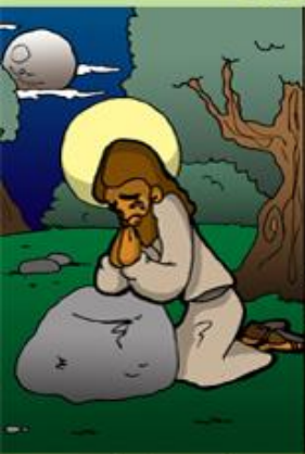
1. Oración de Jesús en el huerto