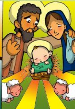
3. Nacimiento del Niño Jesús en Belén.