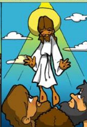
2. Asunción de Jesús a los cielos