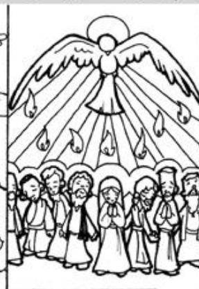
3. Venida del Espíritu Santo