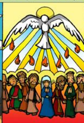
3. Venida del Espíritu Santo