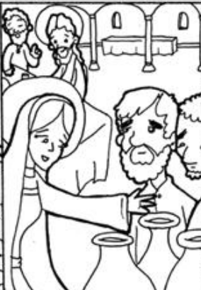
2. Milagro de Jesús en las Bodas de Caná