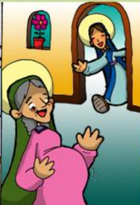
2. Visita de María a Isabel