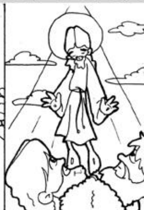
2. Asunción de Jesús a los cielos