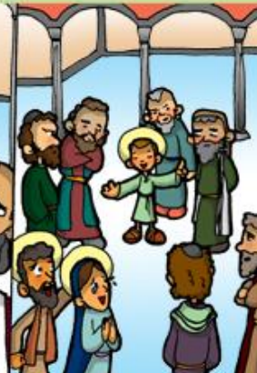
5. Jesús perdido y hallado en el Templo