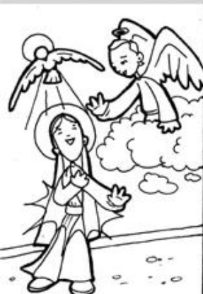
1. Anuncio del Ángel a María