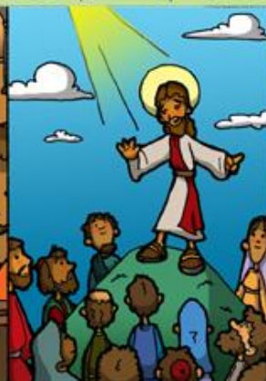
3. Jesús comienza el anuncio del Reino