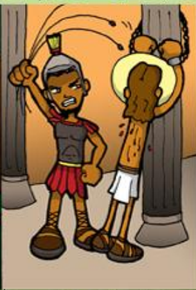
2. Jesús es flagelado