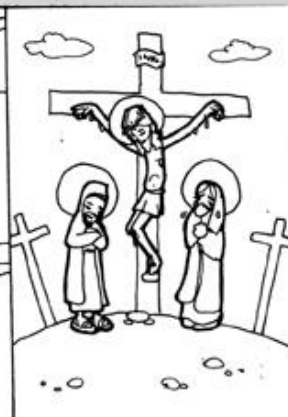
5. Muerte de Jesús en la cruz