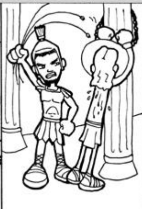
2. Jesús es flagelado