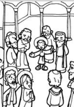
5. Jesús perdido y hallado en el Templo