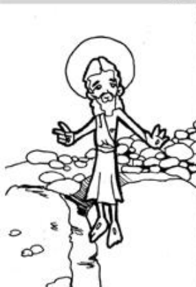
1. Resurrección de Jesús