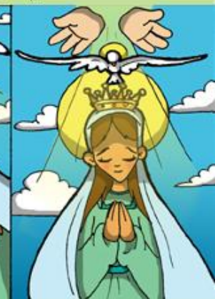
5. Coronación de María como Reina de lo creado