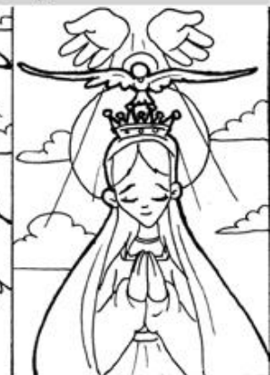
5. Coronación de María como Reina de lo creado