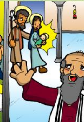
4. Presentación de Jesús en el Templo.