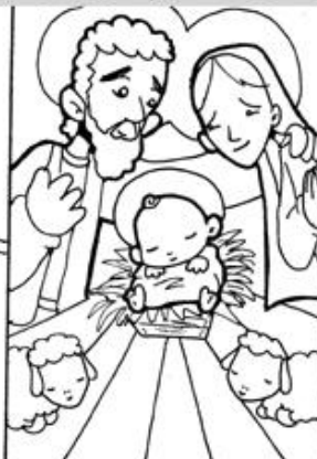
3. Nacimiento del Niño Jesús en Belén.