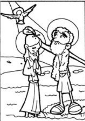
1. Bautismo de Jesús en el río Jordán