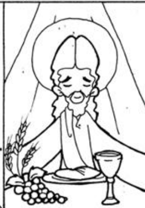
5. Institución de la Eucaristía-Última Cena