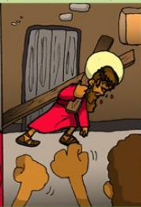
4. Jesús con la cruz a cuestas camino al calvario