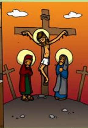
5. Muerte de Jesús en la cruz