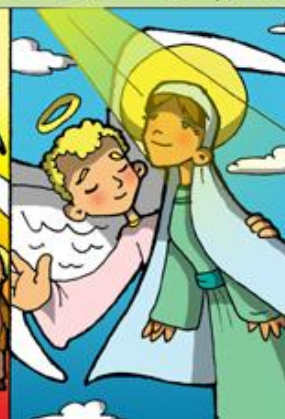
4. Asunción de María a los cielos