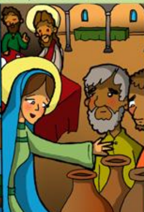
2. Milagro de Jesús en las Bodas de Caná