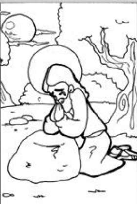
1. Oración de Jesús en el huerto