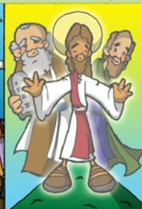
4. Transfiguración de Jesús en el monte Tabor