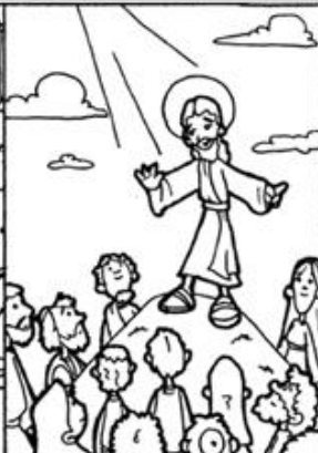
3. Jesús comienza el anuncio del Reino