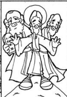
4. Transfiguración de Jesús en el monte Tabor