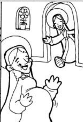
2. Visita de María a Isabel