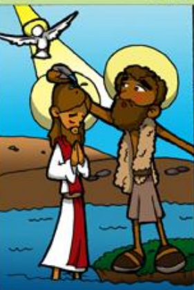
1. Bautismo de Jesús en el río Jordán