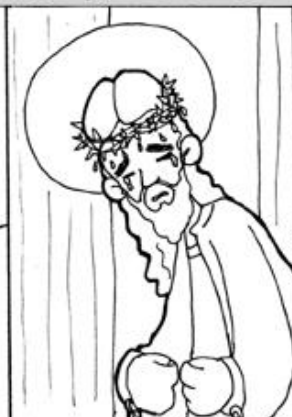
3. La coronación de espinas