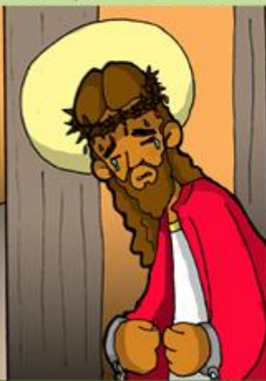
3. La coronación de espinas