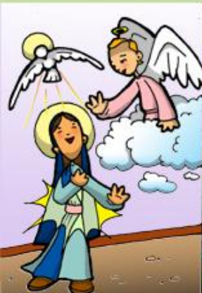
1. Anuncio del Ángel a María