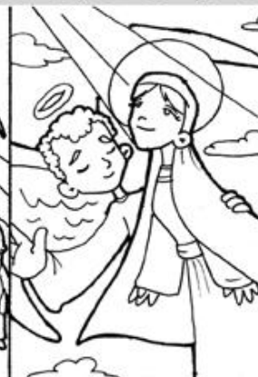
4. Asunción de María a los cielos