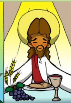
5. Institución de la Eucaristía-Última Cena