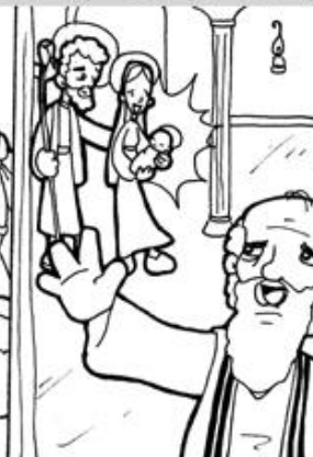
4. Presentación de Jesús en el Templo.