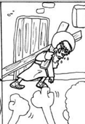
4. Jesús con la cruz a cuestas camino al calvario